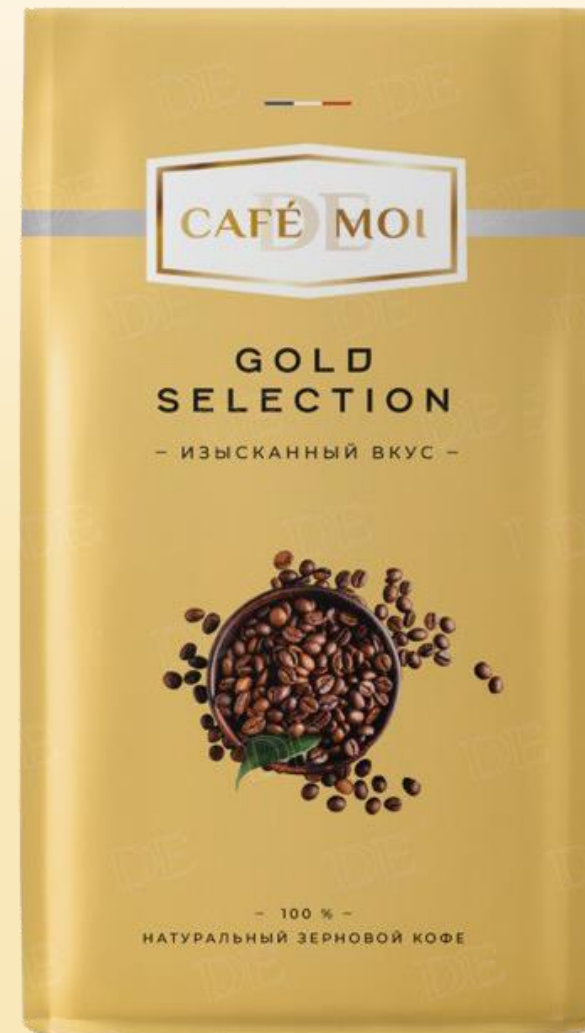
Форматы: 1 кг