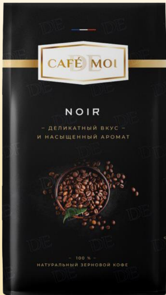
Форматы: 1 кг